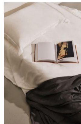
Prodotti T.SILK COLLECTION