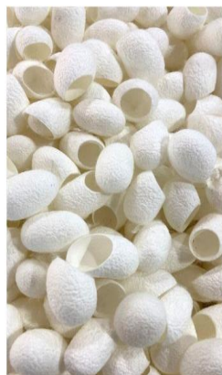
Bozzoli di seta