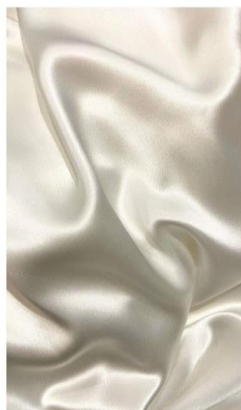
Tessuto in seta T.Silk®